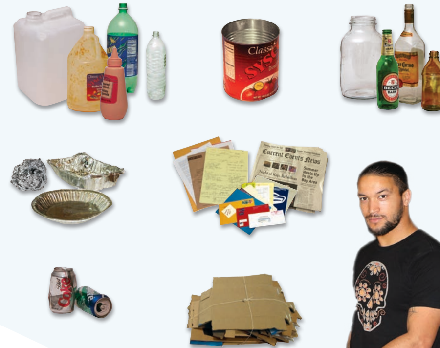
Chop House의 재활용

플라스틱 용기, 알루미늄/금속 음식 용기, 판지, 백지, 유리로 된 음식 및 음료수 용기는 재활용합니다.