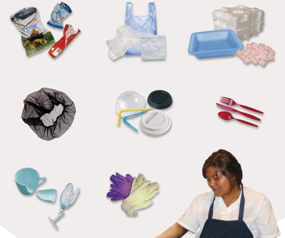
Lugomare의 장갑 폐기