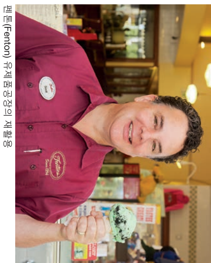
펜톤(Fenton) 유해 폐기물 관리의 재활용

전화 (510) 613-8700 또는 이메일 csnorthbay@wm.com로 연락하세요